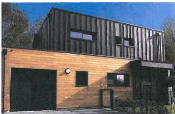
Porte basculante DL, conçue par Novoform, design acier joints creux à l'horizontal teinte 7016