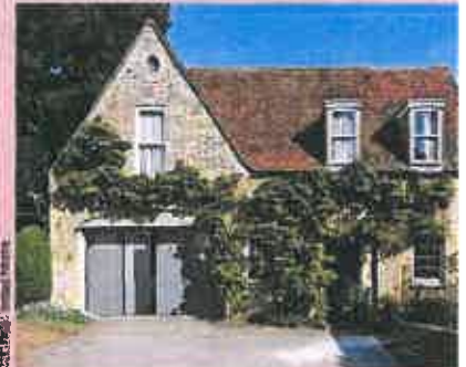
Alu Evolution : une porte battante en aluminium à rupture de pont thermique disponible dans 103 couleurs

à rupture de pont thermique a signé la volonté du fabricant d'améliorer les performances du produit et notamment de régler les problèmes de condensation et de ruissellement. « Nous attaquons la phase 2 en travaillant sur les options (impost, grille défensive pour sécuriser les hublots, quincaillerie laquée, profil de finition masquant les défauts de la maçonnerie) qui seront présentées à Batimat » précise Murielle Langlais, Directrice marketing de Thiébaud Industrie