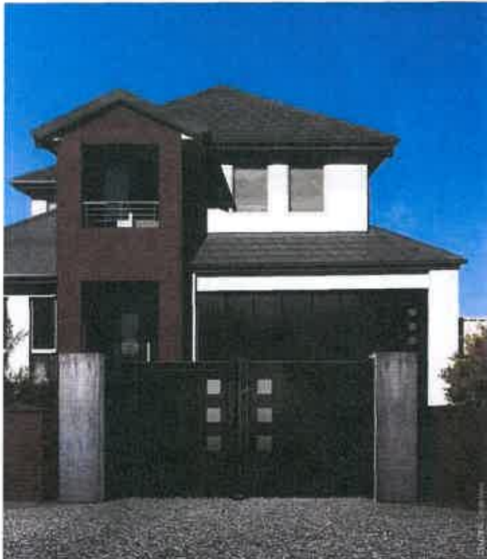
Phoenix, la porte isolante du groupe Maine, dotée d'une âme en mousse polyuréthane haute densité entre les 2 parements

laterale, propose des portails assortis Chez Hormann, Olivier Rigault confirme l'intérêt du marché pour les produits assortis « la porte d'entrée et la porte de garage sont des éléments indissociables de la façade, nous avons également un partenariat avec KSM pour étendre l'offre au portail ». La Toulousaine